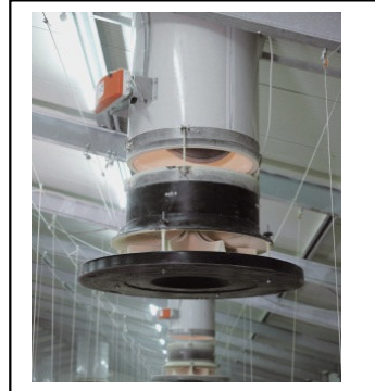
Zuluftkamin für Gleich- oder Überdrucklüftung