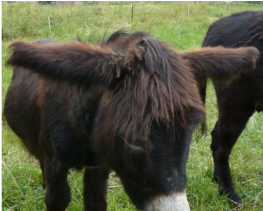
Abb. 8 Helikopterohren

Esel sind von ihrem Naturell her eher duldsam und stoisch. Krankheitssymptome und Schmerzen zeigen sie weniger deutlich als zum Beispiel Pferde. Typisches Ausdrucksverhalten eines kranken Esels sind die hängenden Ohren („Helikopterohren“). Oft werden Schmerzzeichen als „störrisch“ fehlinterpretiert. Deswegen ist oftmals eine frühzeitige Hinzuziehung eines Tierarztes/einer Tierärztin dringend anzuraten.