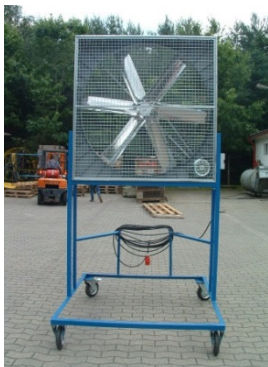
Beispiel eines mobilen Stützluftventilators

Ein natürlich gelüfteter Stall ist mit einer wärmedämmenden Schicht direkt unter dem Dach sowie Licht- und Luftbändern an den Stallaußenwänden ausgestattet. Bei diesen Stalltypen kann es sich auch um Mobilställe handeln. Zu beachten ist, dass sich beim Auftreten von Temperaturspitzen im Sommer die Stallinnen- und die Außentemperatur soweit angleichen können, dass der Effekt des thermischen Auftriebes nicht mehr gegeben ist. Spätestens bei zu erwartenden Enthalpiewerten von 67 kJ / kg Außenluft müssen für die Tiere zusätzliche Maßnahmen (Abluft/Umluft) getroffen werden, um die körpereigene Wärme abzuführen. Hierbei kann es sich auch um mobile Ab-/Umluftsysteme handeln.