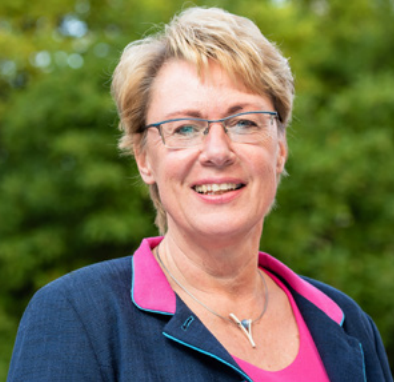
ML / Fotograf: Jaworr